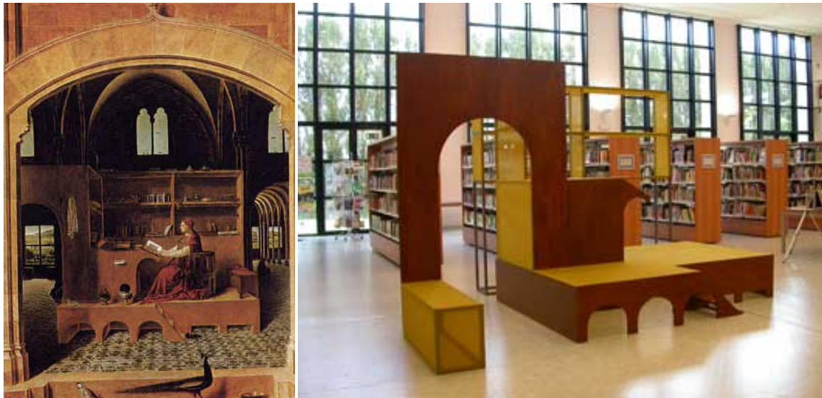
'San Girolamo nello Studio' Antonello da Messina