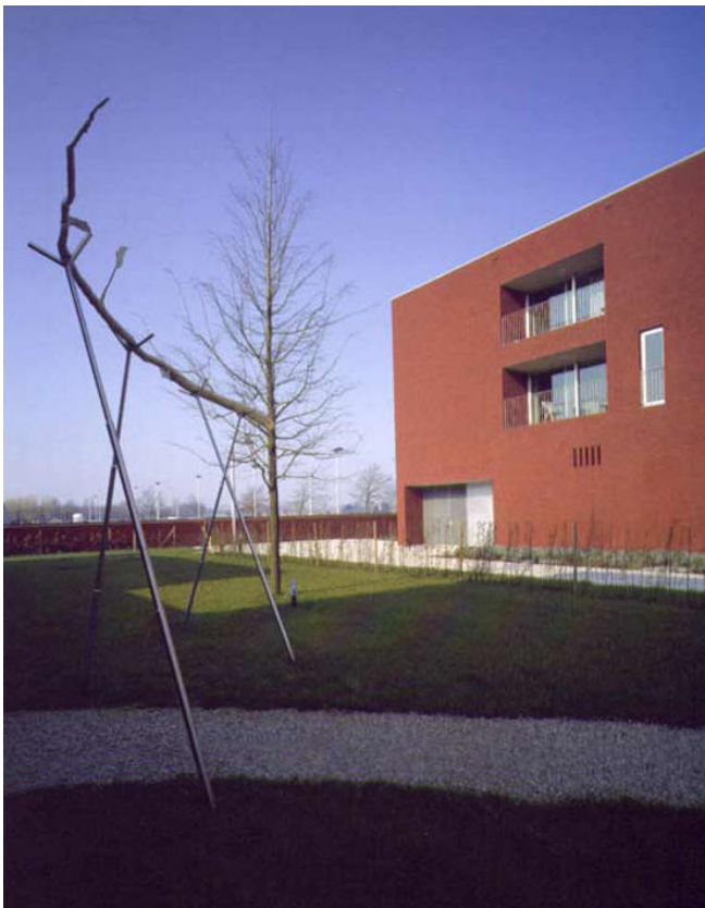
'de Ent' 2009

Het werk in Torhout bestaat uit een lange afgebroken tak, gemaakt uit een glasachtig polyester en gedragen door enkele gevorkte metalen staven. De doorzichtige substantie geeft lichtheid aan de sculptuur, ten teken van hoop: de tak sterft niet, hij houdt een belofte in van groei, van hunkering naar het leven. Zo staat het werk ook symbool voor de psychiatrische patiënt die weer aansluiting zoekt bij de samenleving. De ent zoekt contact met de moederboom, zoals wij ons proberen aan te sluiten bij de maatschappij.