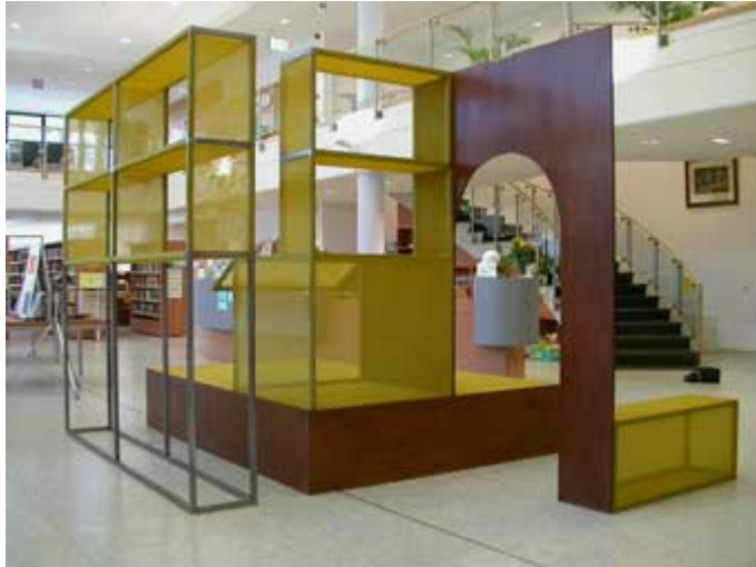
'Skin' installatie – bibliotheek Zwijndrecht, België 2005.