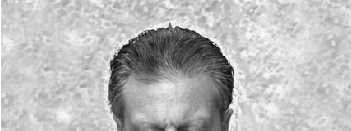
Geist' digitale print op canvas