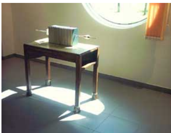
'De gemarkeerde tijd'

In de bibliotheek van Bredene werden naar aanleiding van het kunstproject 'Verticale Stromen' (2002) zeven hedendaagse kunstenaars uitgenodigd om hun bibliotheekvisie in en rond het gebouw vorm te geven. Iedere kunstenaar werd gevraagd om een vestiairekastje aan de ingang van de bibliotheek in te vullen. Stefaan Van Biesen noemde zijn kastje 'De droom van de tuinman III'. Hij toonde er een kleine tuin met aarde en ontluikende woordreepjes. De schoenen van de tuinman (bibliothecaris) stonden werkeloos in het tuintje. Hij suggereert een bibliothecaris die de groei van de woorden aanmoedigt in een bibliotheek als levende tuin voor iedereen. Van dezelfde kunstenaar vond je ook nog het werk 'De gemarkeerde tijd': een verrassende boekentafel in de bibliotheek. Op het tafelblad was een landkaart van de verbeelding getekend. Op die kaart vond je boeken gedrenkt in honing. De tafelpoten stonden eveneens in honingpotjes. Honing stroomt figuurlijk uit de boeken over de tafel. Een bibliotheek vangt de honing (verbeelding) op en biedt ze de bezoeker aan.