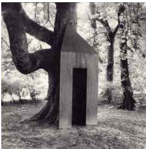
'Fluisterhuisje', Lokeren 1998.