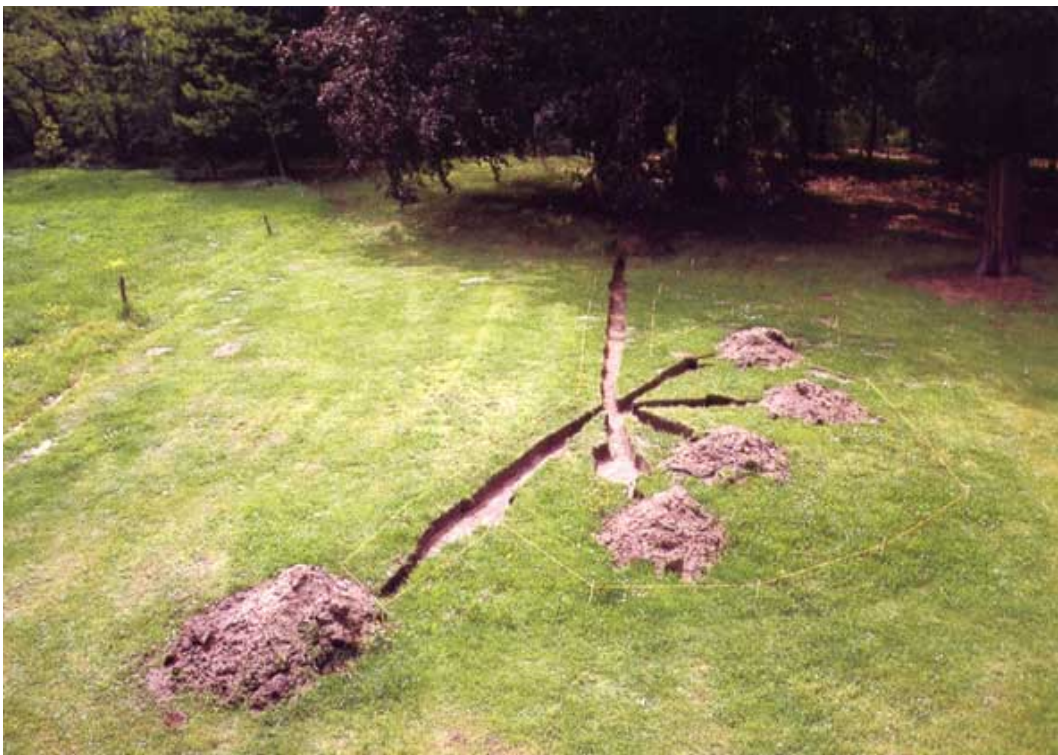
'Brleven aan een boom' 1997. Domherenpark Heusden-Zolder.