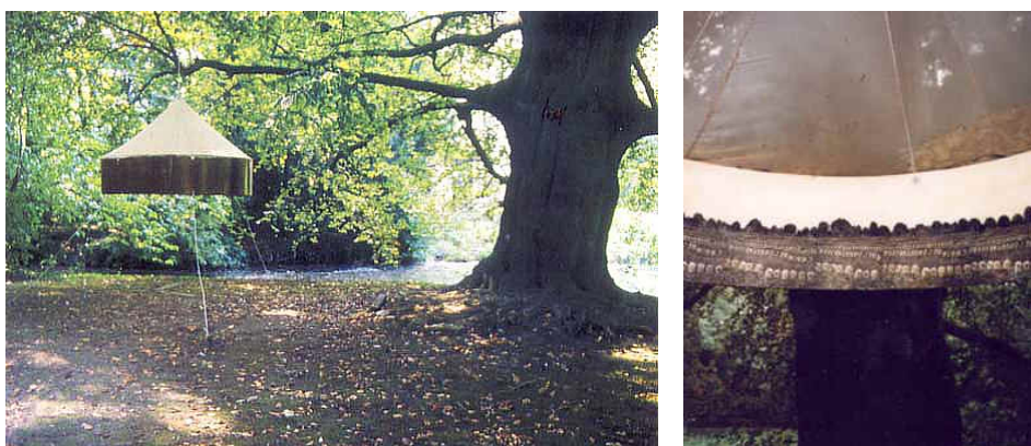
'Landscape/mindscape', 1998 Park Ter Beuken, Lokeren, België.