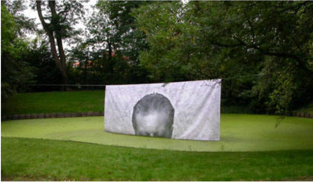
'Geist' Stefaan van Biesen 2006. Casinopark Sint-Niklaas 2006

'Geist' is een print op industrieel zeil, waar het hoofd van de kunstenaar gedeeltelijk op te zien is. De afbeelding zweeft boven het wateroppervlak van een vijvertje in een verzorgd aangelegd parkje. De afbeelding betreft minder een portret, al dat het een plaats wil representeren: het hoofd als de locus van het denken. Paradoxaal genoeg wil de kunstenaar dit rationalistisch cliché tegelijk ontcrachten. De cognitieve capaciteit van de mens lokaliseert zich niet enkel en alleen in de hersenen, of ander gesteld: wat betekent deze verabsolutering, als dit denken niet tot andere zaken gerelateerd wordt? In het oeuvre van Stefaan van Biesen is er een associatieve hechtheid ontstaan tussen: denken, handelen, omgeving en welzijn. Als vraag geformuleerd: hoe manifesteren onze gedachten zich via handelingen in onze omgeving en in welke mate komen ze ons welzijn ten goede?